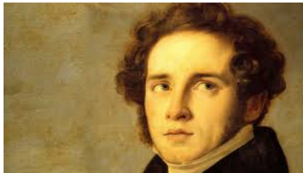
RICHARD WAGNER 1813/1886 (dramma in musica.....liet motiv)