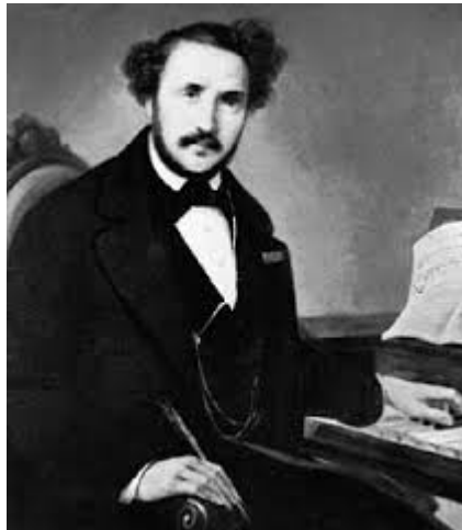
GAETANO DONIZETTI 1797/1848